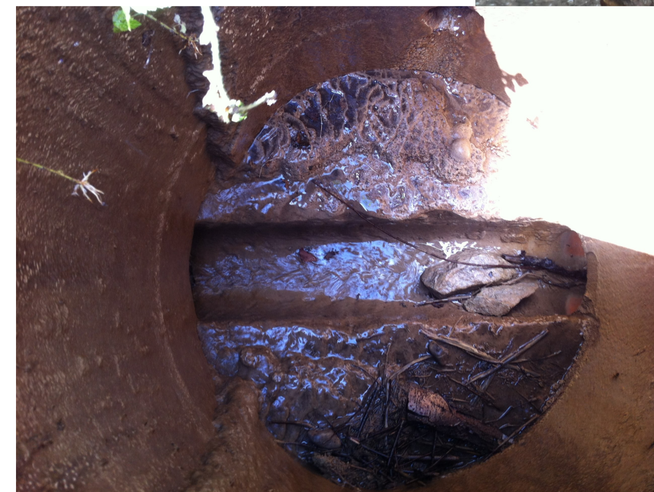
Zustandserhebung der Ableitungen und Schächte