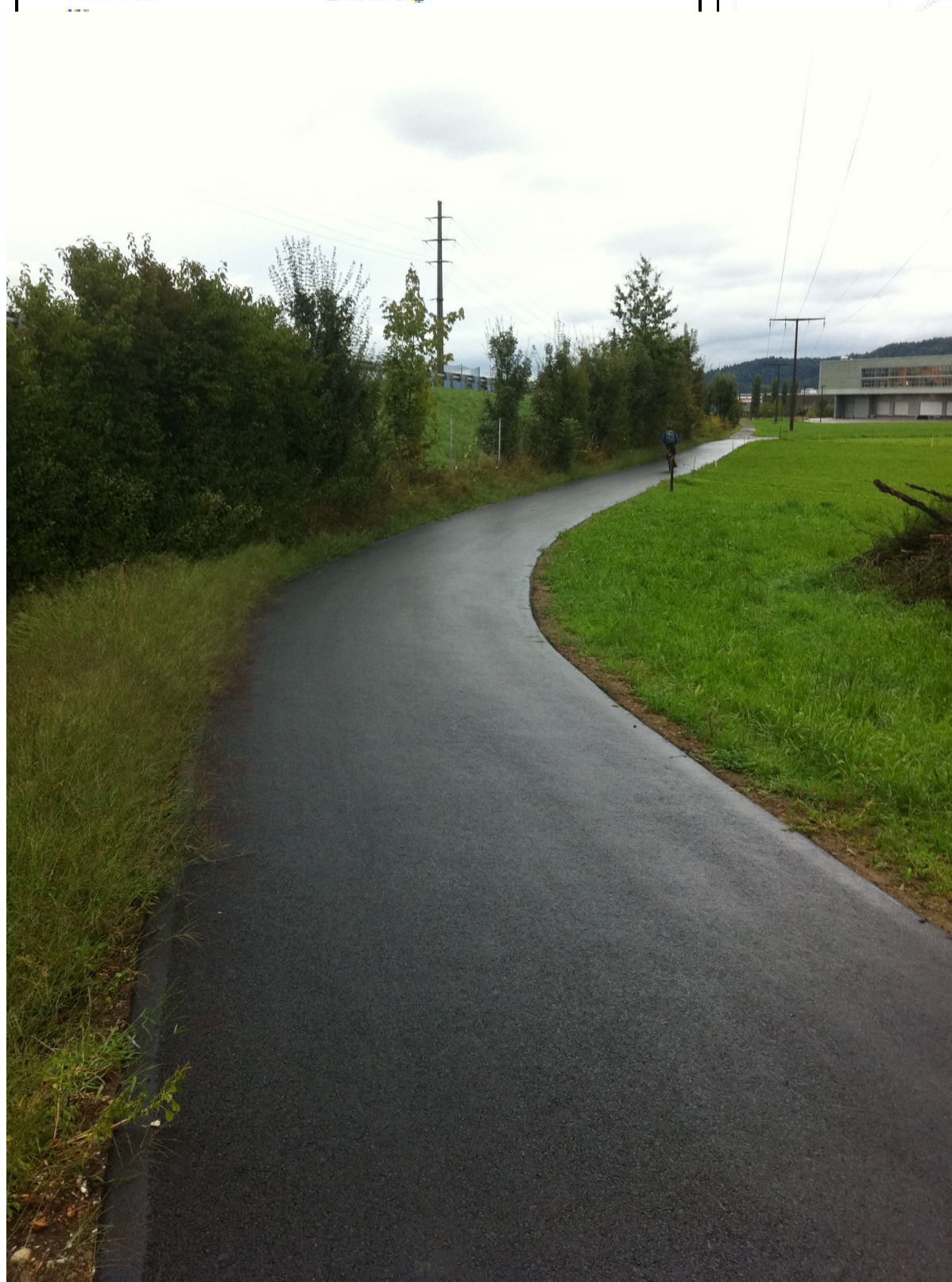
Erneuerung Belagsweg (für die Landwirtschaft und als Schulradweg)

Beitragsgesuch (Auszug aus Bericht zur PWI)