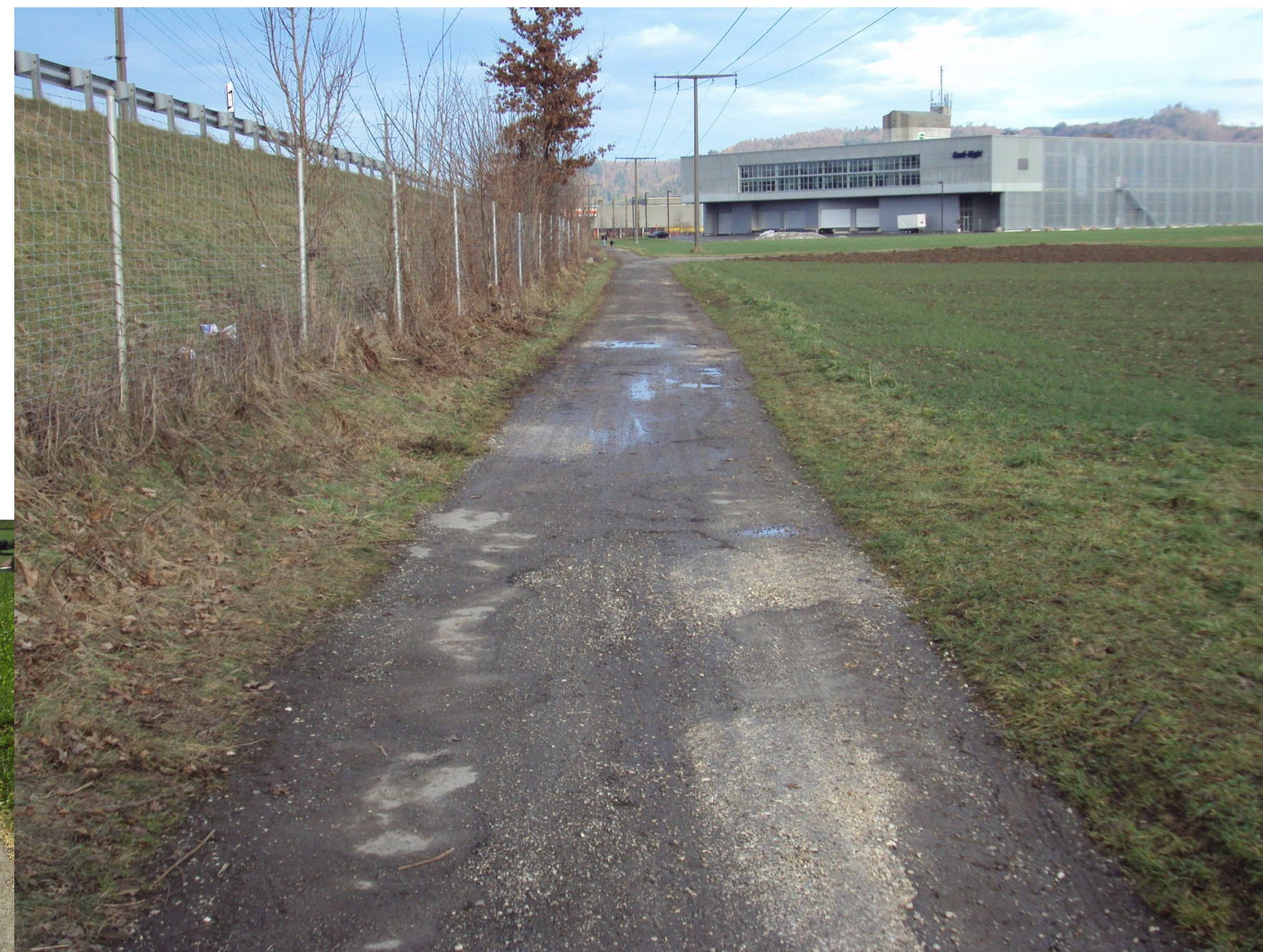
Zustandserhebung der landwirtschaftlichen Haupt-Erschliessungswege und der primären Hofzufahrten