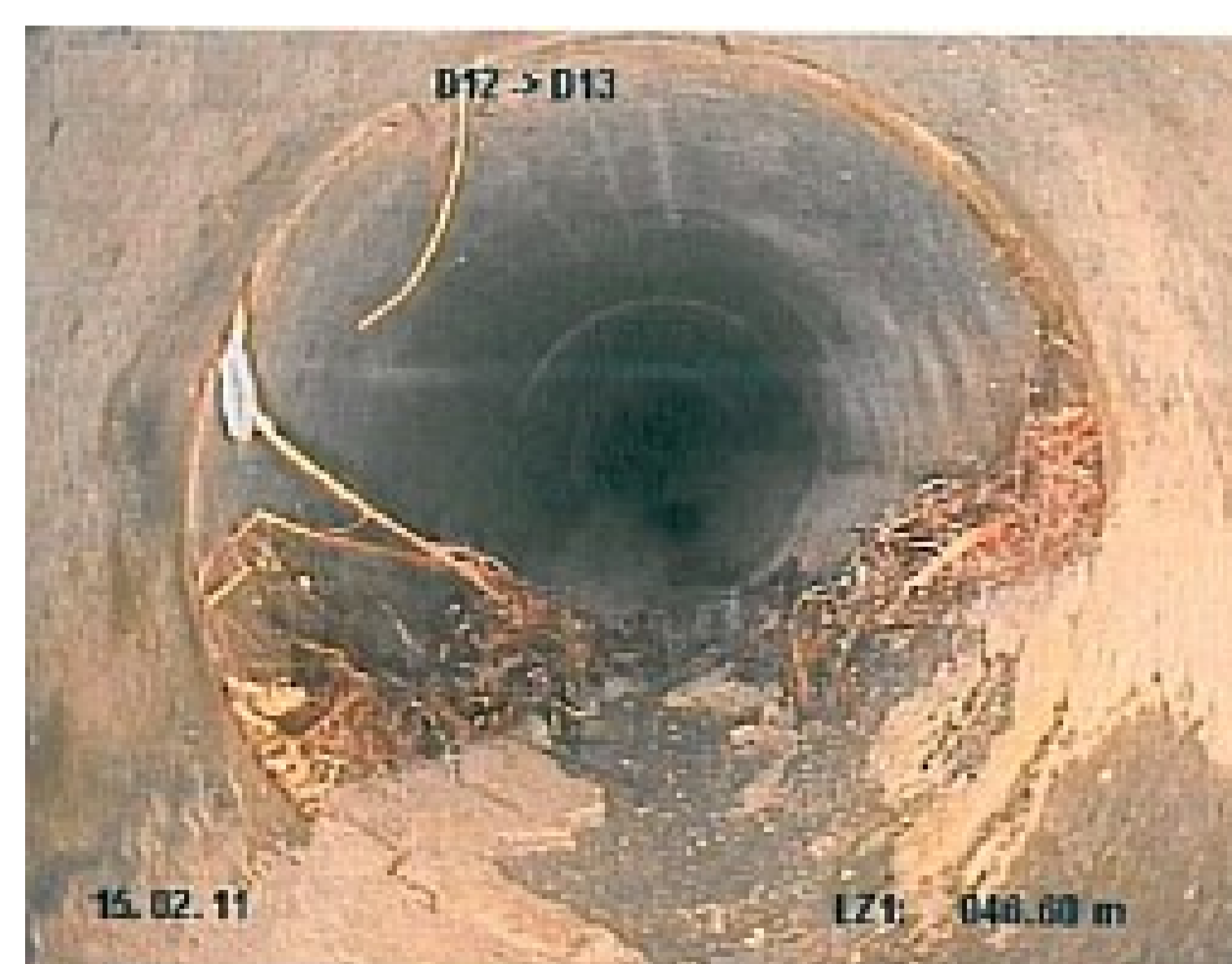
Hausanschlussleitungen (Organisation von Zustandsaufnahmen von privaten Hausanschlussleitungen)

Dichtigkeitsprüfungen von Landwirtschaftlichen Hofdüngeranlagen und Regenklärbecken, Auswertung und Bericht an kantonale Stelle