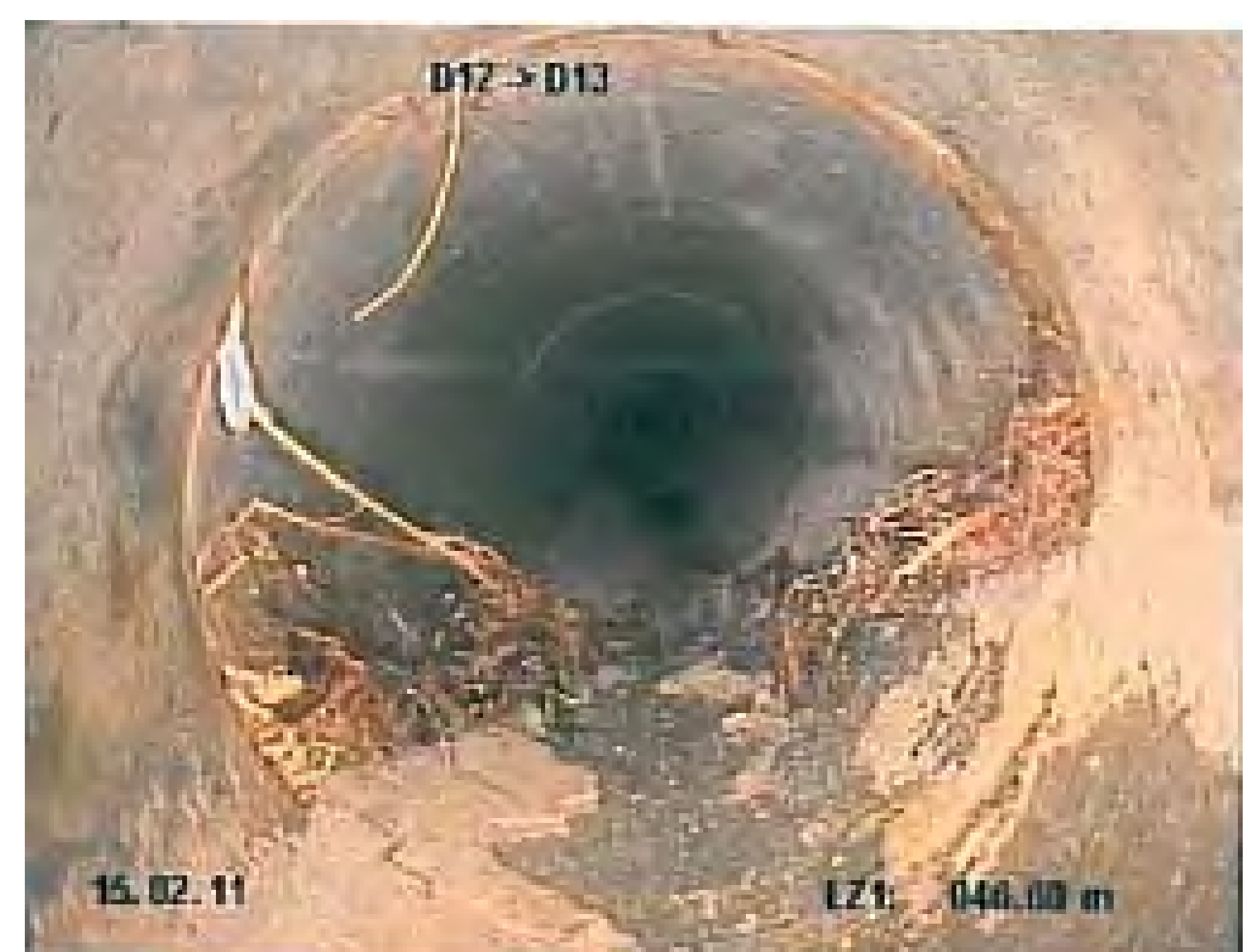
Hausanschlussleitungen (Organisation von Zustandsaufnahmen von privaten Hausanschlussleitungen)