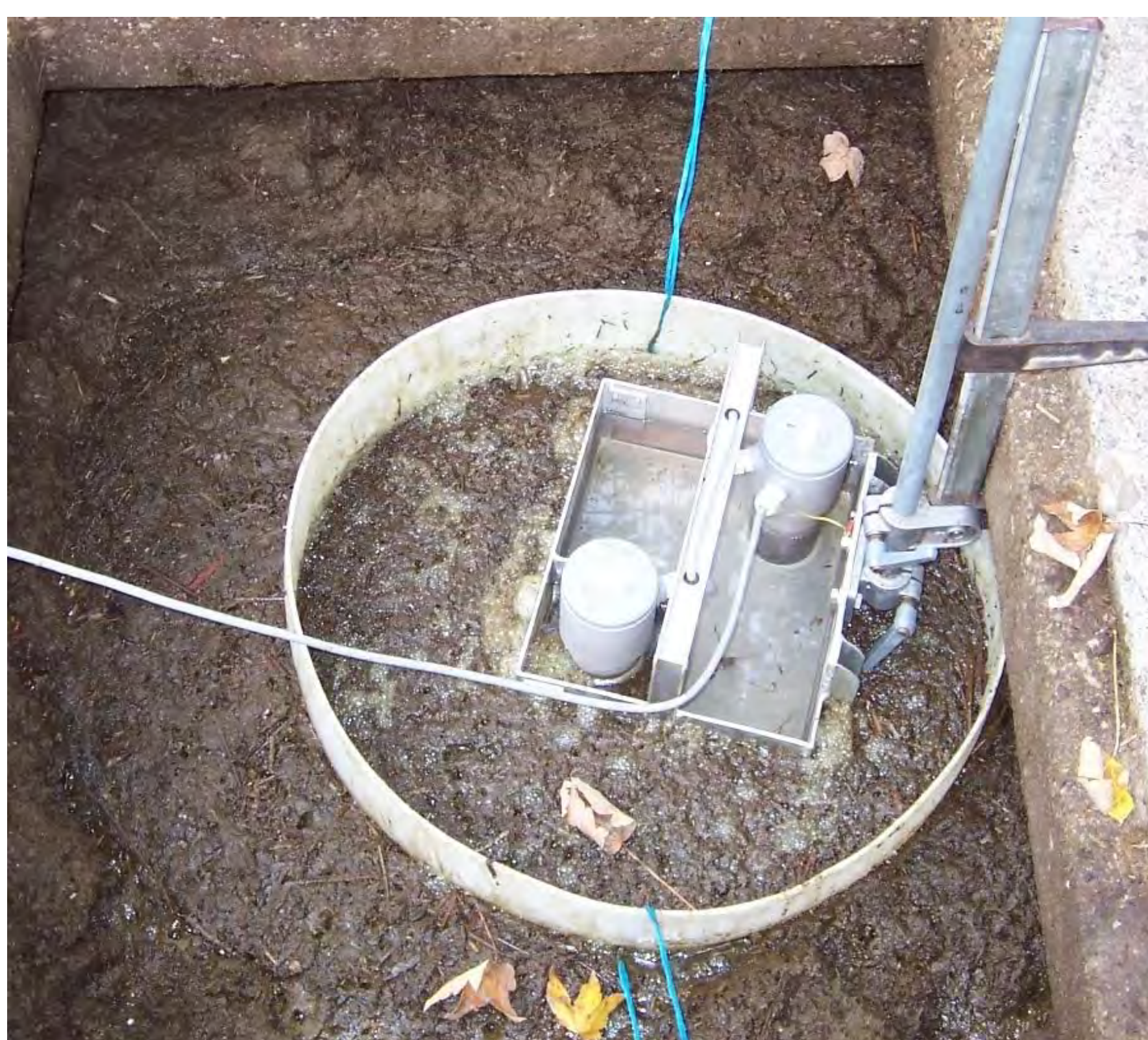
Dichtigkeitsprüfungen von Landwirtschaftlichen Hofdüngeranlagen und Regenklärbecken, Auswertung und Bericht an kantonale Stelle