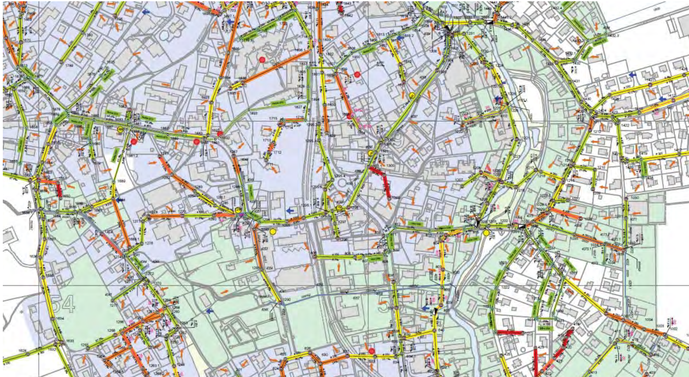
Beratung Entwässerungskonzepte (technisch, gesetzlich, GEP)

Als Spezialisten für Entwässerungsleitungen und Liegenschaftsentwässerung führen wir für Sie folgende Dienstleistungen aus: